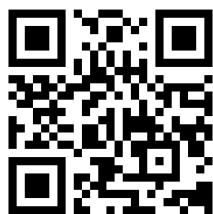
公益社団法人24時間テレビチャリティー委員会