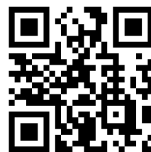
読売テレビ 24時間テレビ

参加のご案内をお読みいただきましたら次ページからの 申請書にご記入の上、原本を郵送にてお申込みください。