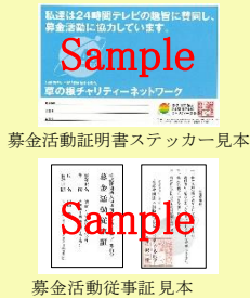
募金活動証明書ステッカー見本